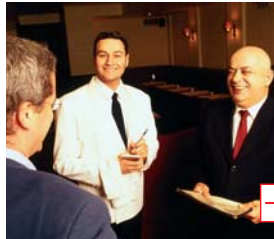
Tableau de bord clients Actions commerciales Mailing et e-Mailing